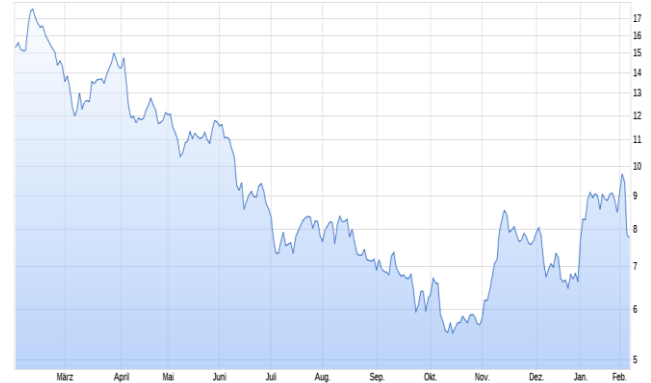
■ ams-osram AG (SIX Swiss Exchange)